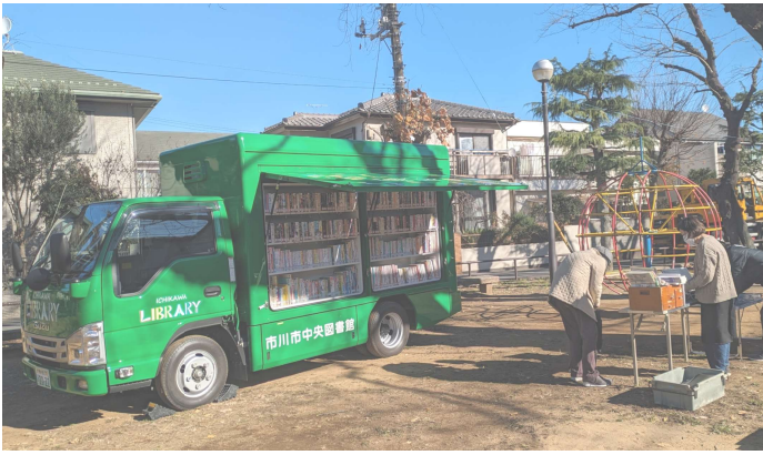
国府台児童公園に寄った自動車図書館「みどり号」