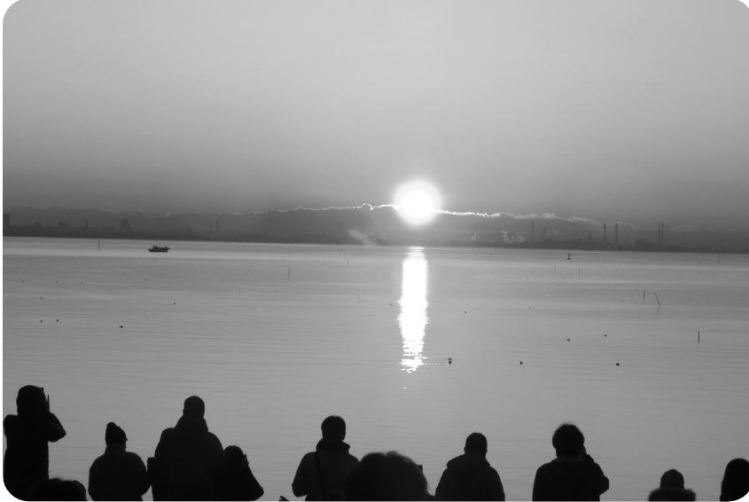
三番瀬公園から臨む初日の出

「市川三番瀬を守る会」のみなさんと恒例の初日を見る会に参加しました。駐車場は、太陽が昇る1時間前には満車となり、道路にも車が列を作っていました。 房総半島にかかった雲から、真っ赤な太陽が顔を出し、歓声が上がりました。「穴場だと聞いてきたのに、すごい人ですね」と、見ている人が話していました。