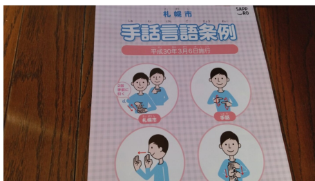
基本的な手話を分かりやすく紹介 目的・理念・市の責務など

帯広市は、全国比較で、自殺される方が多く、20歳代や30歳代における死因の第一位が「自殺」という状況です。誰も自殺に追い込まれることのない社会の実現を目指し、「生きることの包括的な支援」として自殺総合対策を推進しています。生活に密着した事業、相談窓口など、様々な課題に取り組む各組織が、連携しています。市川市でも、活かしていききたい体制です。「生きるを支えるハンドブック」は優しさにあふれています。