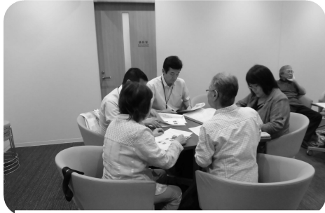
改修してほしい箇所の確認をする南行徳地域の方々

8月10日、行徳を4つの地域に分け、市政アンケートの回答をもとに作った要望書を市へ提出しました。昨年以上に寄せられた地域の要望は、やはり道路や歩道の改修が一番多く、カーブミラーや信号の設置、毎年要望しているものもなかなか実現できないものもありますが、引き続き要望していきます。アンケートを行う