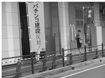
今年6月近隣の住民とともに反対運動

ようになったなど生活実態はますます厳しいとの答えが多かった。 ▼行徳地域の特徴は、歩道が凸凹で歩きにくい ▼自転車専用道路が途中で切れてしまいいろいろ不便 ▼行徳地域から八幡に行く交通手段が非常に不便 ▼駅に近い所でも街灯が少なく暗く危険な場所が多い ▼信号機やカーブミラー、横断歩道の白線など危険に関わることはすぐにやっ