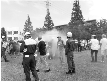
8月27日行徳で行われた防災訓練