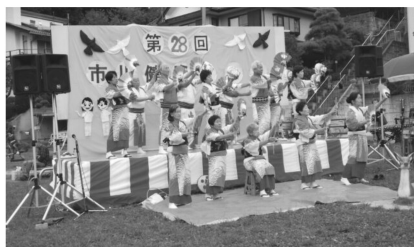
老人会の皆さんが日頃の練習を披露

10月12日、じゅんさい池緑地で第28回健康まつりが開かれました。台風も心配されましたが、秋