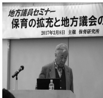
セミナーでは参加者から待機児童の質問が多く出されました