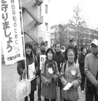
行徳地域から参加した 仲間たち、私も一緒です