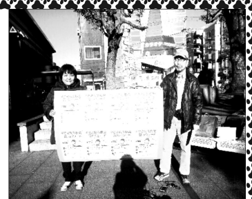
行徳駅で参加を呼びかけました