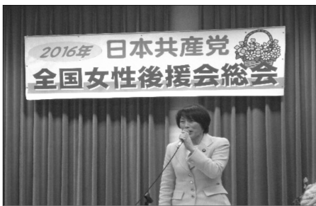
新しい政治を切り拓こうと党全国女性後援会総会で話す、田村智子参議院議員

労働環境の破壊や低賃金により子どもの教育費にまでお金が回らない昨今。高校生がバイトで生活費をまかなうことも少なくなき、長時間のバイトで、勉強する時間も体力も残されていないという深刻な状況です。大学へ進学しても、アルバイト漬けの学生生活、教育ローンを抱えて卒業、低賃金で返済が滞る。これでは若者が夢を語ることはできません。今の政治をなんとかしても変えなければなりません。7月の参院選を全力で闘う決意です。連鎖する貧困にストップを！