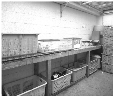
12分別を丁寧にしている集合住宅