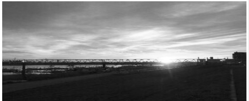
元日江戸川放水路土手からの日の出