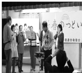
昨年のつどいの様子

日時 1月23日(土) 午後1時半～4時 場所 行徳駅前公園研修室 参加費 300円