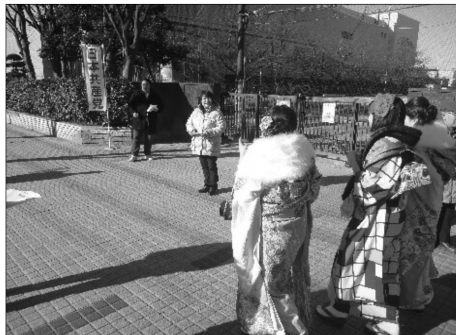
10日式典に向かう新成人に訴える

問題や教育問題、平和と民主主義の問題など訴えました。また、戦争法廃止の署名にもとりくみました。式典は、国府台高校の吹奏楽の演奏に始まり、12名の実行委員で企画された映像が流れました。その映像には母校の前で将来の夢を語る若者が紹介されました。戦争で夢を壊すようなことがないように、平和を守ることの大切さを改めて感じました。