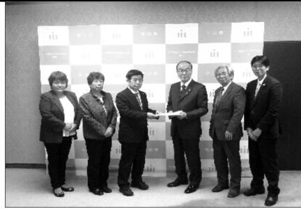
12月11日、来年度の予算要望書を大久保市長に提出する共産党市議団

議会の最終日、市政アンケートに基づき要望書をつくり、提出しました。懇談の中で大久保市長は、公民館などの公共施設の値上は、何十年も据え置いてきた結果で仕方のないことだと話しました。本会議の中でも清水議員が利用者がこれま