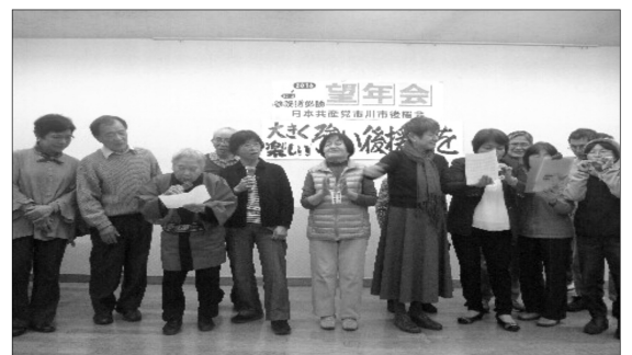
「植生の宿」を合奏&合唱する行徳地域の仲間たち