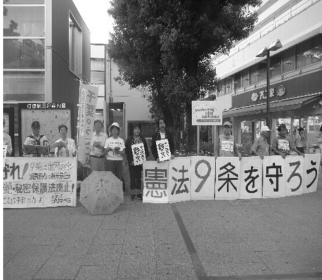
行徳駅で火曜日の夕方宣伝に取り組んでいます