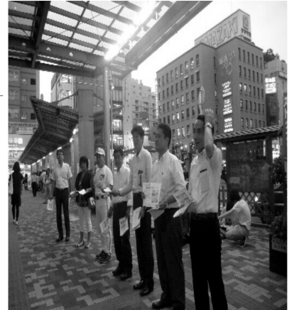
8月7日市川駅北口で超党派で宣伝・定期的開催

アンケートにご協力お願いします 毎年、日本共産党の議員団は市政アンケートを行っています。まだお手元にあります。またお手元にあっても結構です。国政、県政、市政への要望や思い、どんなことでもお書きください。お送りください。皆さんの貴重なご意見お待ちしています。切手は不要です。地域の要望などは住所とお名前があると早く対応することができます。 9月議会は4日スタートします。 9月議会は、8月28日の午後5時までに議会事務局にご持参ください。印鑑等も必要ですので、事前にご連絡いただければ説明いたします。 一般質問も予定しています。日程がわかりましたらお知らせします。どうぞ傍聴に来てください。9月議会では決算委員会もありますので10月ははじめまで開かれています。