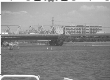
8月6日、行徳議員連盟で消防艇ちどりの視察しました。