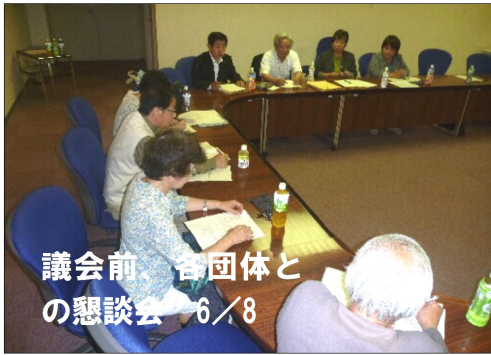
議会前、各団体との懇談会 6/8