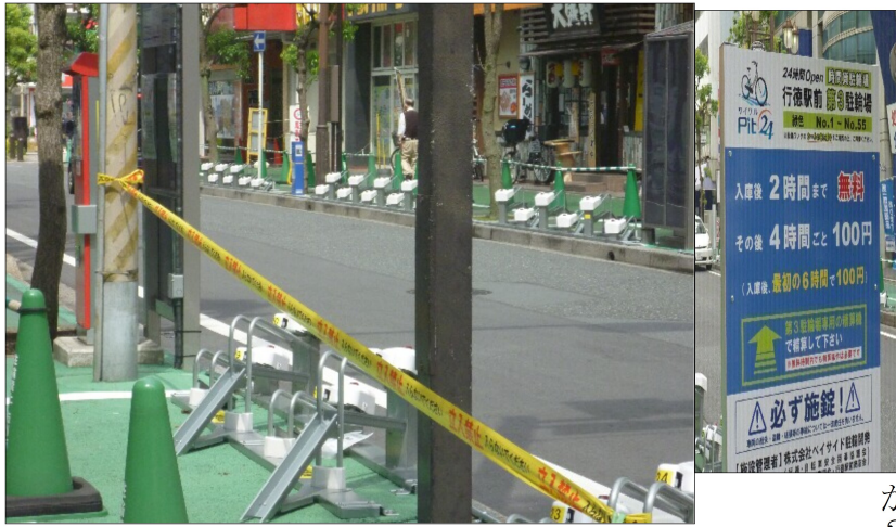
行徳駅西口約100台分の有料駐輪場

南行徳では住民の方々が有料化反対の署名に取り組んでいます。私たちは決して安くはない市民税を払っています。住民へのサービズとはいったいなんでしょう。駐輪場にかかるコストをすべて受益者負担として使用料を課すのはいかがなものでしょうか。駅近くの有料駐輪場は2時間まで無料です。皆さんはどう思いますか？