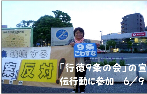
「行徳9条の会」の宣伝行動に参加 6/9

6月7日、地域のみなさんと公園の草刈りをしました。日焼けと虫対策で完全に防備。左利き用の鎌も用意された。いままではボロボロ汗かきま