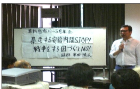
危険な戦争する国づくりへの道をなんとしても阻止しよう